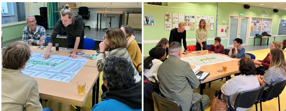
Architectuurtafel en landschapstafel met bewoners, omwonenden en vertegenwoordigers van o.a. Okra en Architectencombinatie

Deelnemers aan de brainstormsessie werden verdeeld over twee groepen van circa 10 personen aan twee verschillende tafels: een architectentafel en een landschapstafel . Na twee uur met elkaar van gedachten te hebben gewisseld was er een korte pizza-break. Hierna wisselden de groepen van tafel. Op de tafels lagen diverse kaartjes met verschillende onderwerpen, ondersteund met foto's. Iedereen pikte hier de kaartjes uit die voor hem of haar aansprekend waren. Zo ontstond uiteindelijk een goed beeld van ieders wensen en ideeën voor de toekomst die zij graag zouden verwerkt zien in project Vijf Heesters.